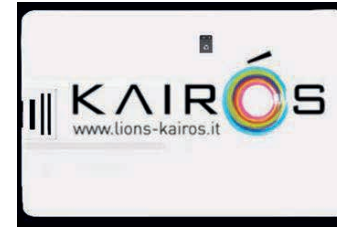
Chiavetta USB con la storia narrata

È possibile richiedere una chiavetta USB a noi Lions oppure ascoltare e/o scaricare le tracce audio della storia direttamente dal sito Internet www.lions-kairos.it