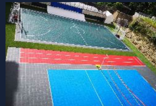
Intervento outdoor grandi dimensioni