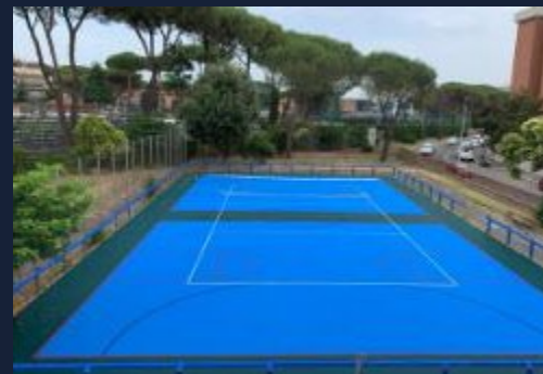
Intervento outdoor medie dimensioni